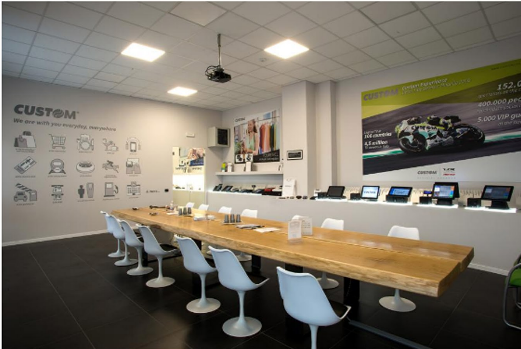
Le tecnologie Custom sono utilizzate in 15 paesi tra cui anche la Russia.

La penetrazione del marchio nel mercato della Federazione si è fatta nel tempo. “Custom Russia è nata sviluppando il mercato in ambito industriale e parallelamente nel settore di automazione dei pagamenti in ambito bancario, poi nel tempo, essendosi sempre più consolidato il mercato, ha diversificato lavorando anche in ambito istituzionale, postoffice , railways e del food - spiega il manager -. Sempre più oggi stiamo sviluppando la tecnologia richiesta per lo sviluppo dell’automazione in settori paralleli come il Ticketing e l’ Aviation , o l’ Entertainment . La nostra scelta è stata sin da subito di presentarsi pro-attivamente con “soluzioni customizzate” soddisfacendo un vero e proprio bisogno latente: alta tecnologia relativa a meccanismi di stampa totalmente modulabile e personalizzabile in funzione di progetti specifici”. Per farlo, la società ha investito nella formazione del personale locale.